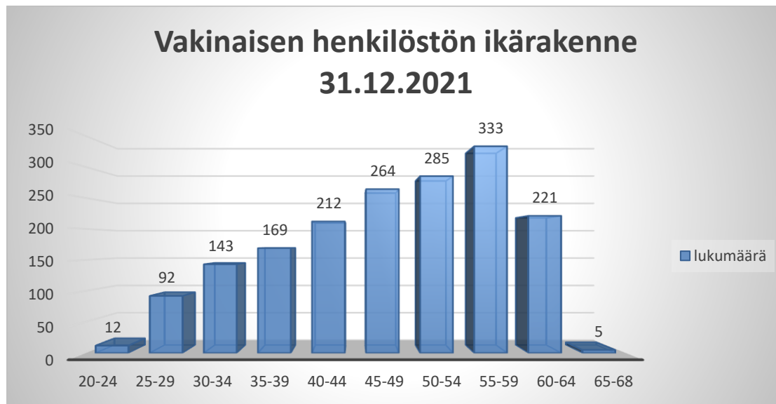
Kuva 2. Vakinaisen henkilöstön ikärakenne

henkilöstöjohtamisessa tulee jatkossakin ottaa huomioon ikääntyvien johtaminen osana työhyvinvoinnin johtamista.